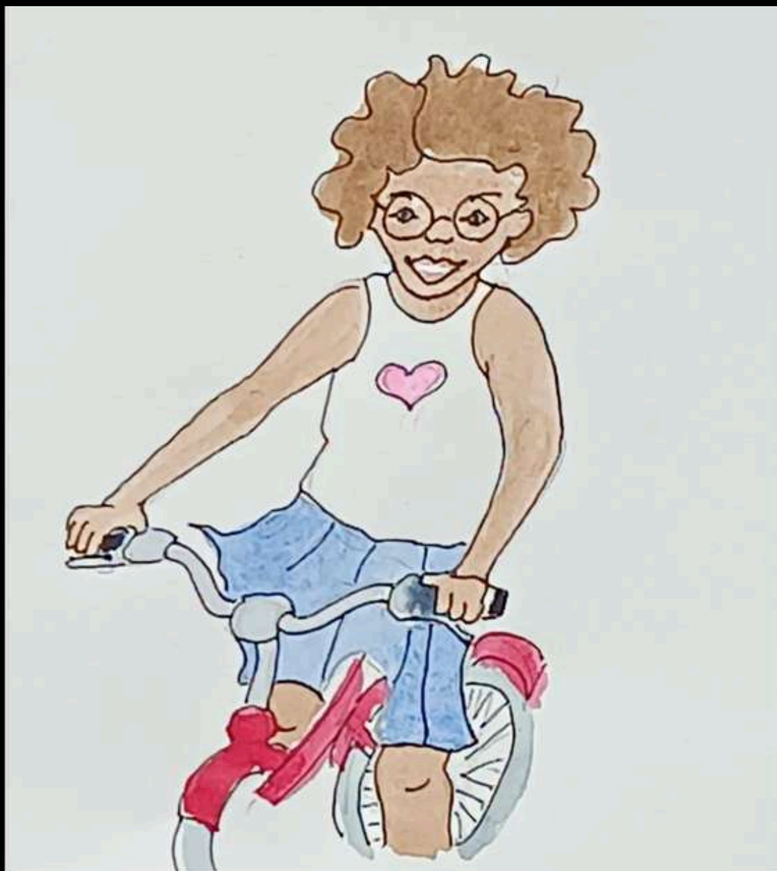
Ilustração: Marie-Hélène Dupuis